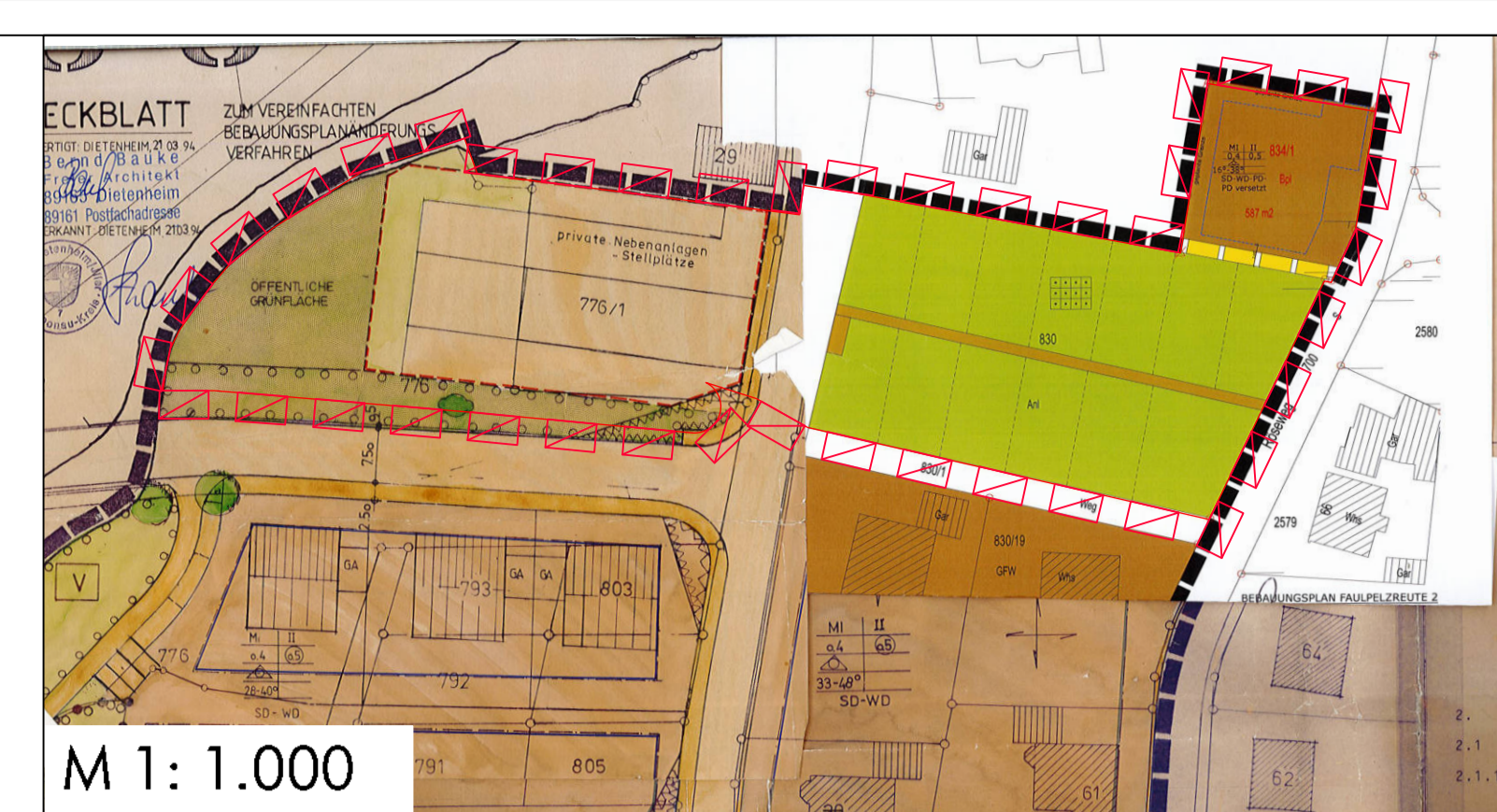
Bebauungsplan "Faulpelzreute 2" (Fassung vom 16.05.1988, rechtsverbindlich seit 02.12.1988)